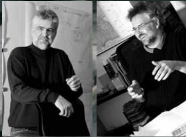
FÜHRUNG DAS MAG_3

imposantes Ergebnis steht. Für eine nicht ganz unbekannte Unternehmensberatergruppe haben wir als GU Beton gegossen, Eisen geschweißt, Glas verbaut, Klimaanlage und Heizung installiert und zu guter Letzt fein geschwungene Schränke konstruiert und Mobiliar geliefert. Jetzt finden dort wichtige Besprechungen, Präsentationen und Beratungen statt. Fein.